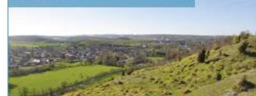
VALLÉE DE L'AA DEPUIS LES COTEAUX